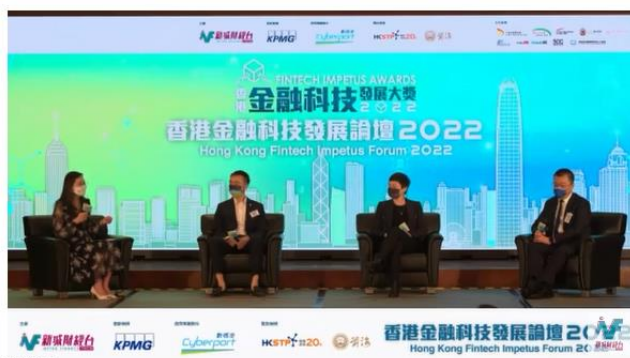
【香港金融科技發展大獎2022 暨 香港金融科技發展論壇】足本重溫

https://www.youtube.com/watch?v=xsKFBYUS_SU