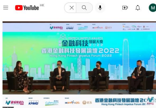
【香港金融科技發展大獎2022 暨 香港金融科技發展論壇】足本重溫

https://www.youtube.com/watch?v=xsKFBYUS_SU