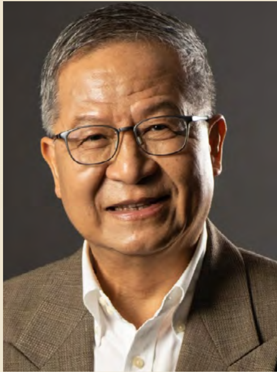
梁榮武教授 前香港天文台 助理台長