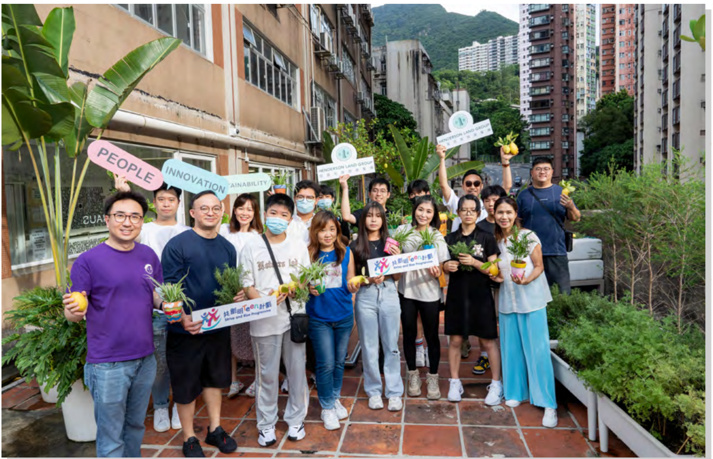
一眾恒基系和百仁基金的友師和學員參加「藝術遊走中西區×升級再造工作坊」

恒基地產作為在香港舉足輕重的企業，如今目標明確地推廣ESG，相信能起帶頭作用，與香港共創可持續未來。